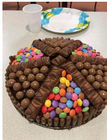
Gâteau réalisé par l'atelier cuisine suivi d'un goûter d'anniversaire d'une élève.

Vous n'avez qu'à choisir l'activité et à remettre la fiche au personnel du