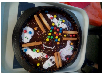
Gâteau d'Halloween réalisé par les élèves pour un goûter de l'Ecole ouverte.